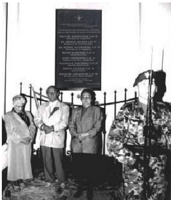
W czasie apelu poległych przemawiał prezydent Bydgoszczy Roman Jasiakiewicz.