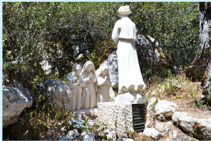
3. Miejsce 1 i 3 objawienia Anioła w Aljustrel