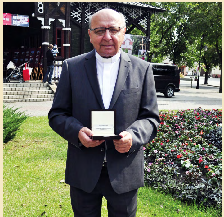
Fot. Małgorzata Szydłowska