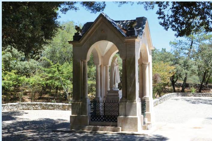
2. Kapliczka stoi w miejscu objawienia Matki Boskiej w dniu 19 sierpnia w Aljustrel