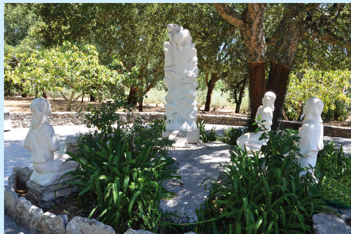
4. Miejsce 2 objawienia Anioła, przy studni, w pobliżu domu Łucji