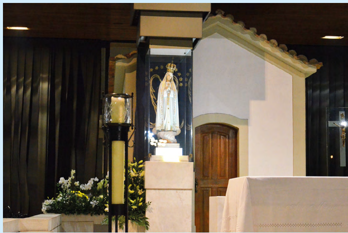
1. Figurka na postumencie stoi w miejscu objawień Matki Boskiej 13 maja, czerwca, lipca, września i października