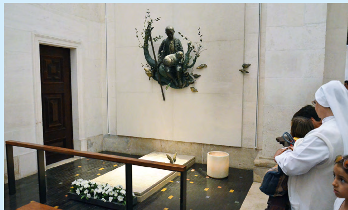
Bazylika MB Różańcowej